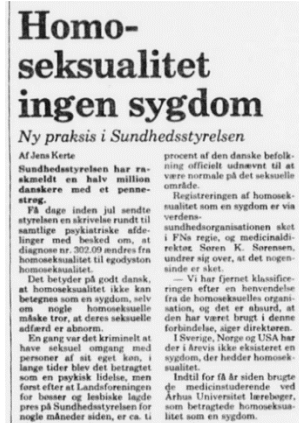
Figur 4 Politiken 4 januar 1981 side 4. https://www.e-pages.dk/politiken/18517/1/?qatoken=dXNlcl9pZD1jNTdiOTYxZC1lMjQ1LTRmYjltYjEzNi00MzEwZmM0NzI2YjYmdXNlcl9pZl90eXBIPWN1c3RvbQ%3D%3D