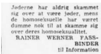
Figur 3 Citat af Rainer Werner Fassbinder til informationen 1977 - https://www.e-pages.dk/politiken/46116/1/?qatoken=dXNlcl9pZD1jNTdiOTYxZC1lMjQ1LTRmYjltYjEzNi00MzEwZmM0NzI2YjYmdXNlcl9pZl90eXBIPWN1c3RvbQ%3D%3D